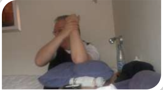
Jarin käsijumppaa, toiset käyttäjä apuna lasia.

Tässä on nyt raportti koko viimevuoden lopun ja tämän vuoden alun kilpailuista. Viime raportti päättyi Suomen NEZ-kilpailuihin Pohjanmaalla. Kisassa ilmennyt kytkimen luistaminen korjaantui asetelman ja vauhtipyörän välistä poistettujen prikkujen avulla. Säätelin kytkimen irrottamaan kunnolla ja kaiken piti olla kunnossa.